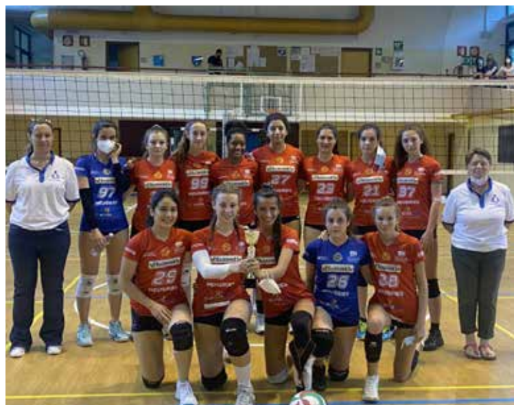
Die starke U19