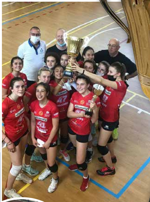
U15 White, Landesmeister 2021