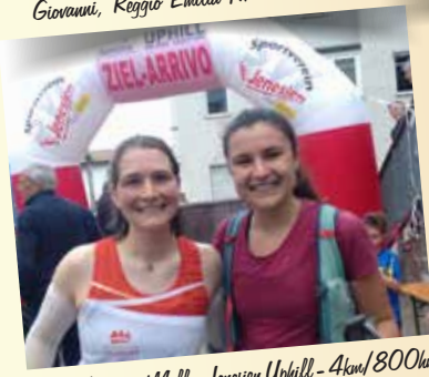
Noomi und Melly, Jenerien Uphill - 4km/800hm