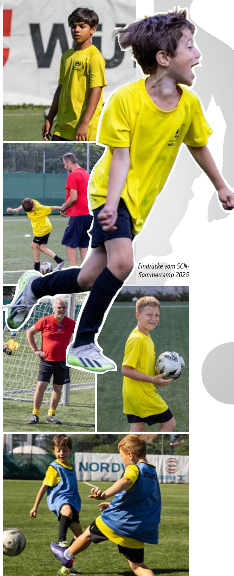
Eindrücke vom SCN-Sommercamp 2025