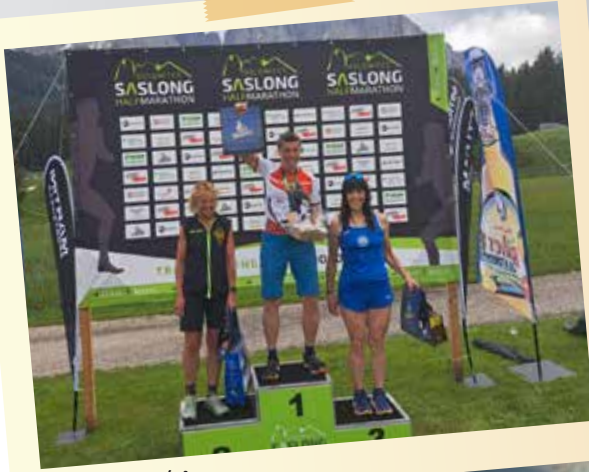
Heidi, Saslong HM