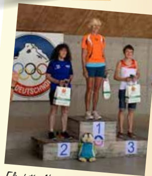
Elisabeth, Nova Ponente