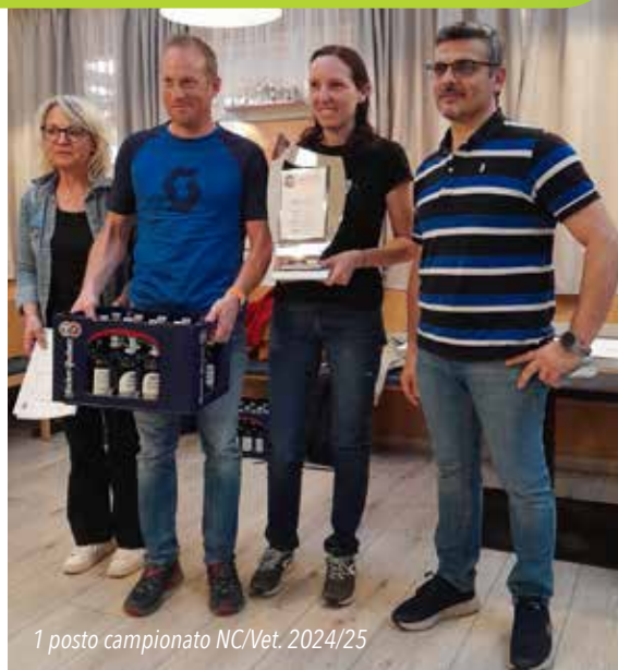
1 posto campionato NC/Vet. 2024/25

Data e ora: Consulta la brochure Fitet o scansiona il codice QR!