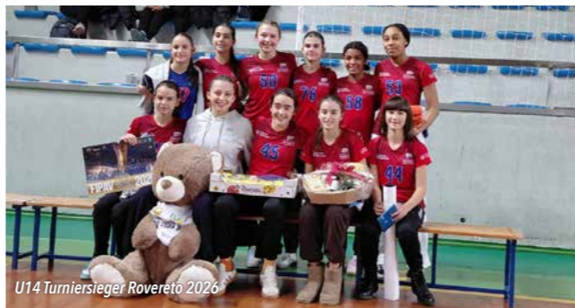
U14 Turniersieger Rovereto 2026