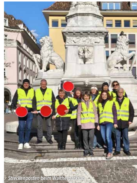
Streckenposten beim Waltherparkrun

Auch am 09.11.2025 wurden wir wiederum als Streckenposten für die erste Ausgabe des Waltherparkrun angeheuert und so haben 10 Streckenposten mitgearbeitet und auch hierbei zur Sicherheit der Teilnehmer beigetragen.