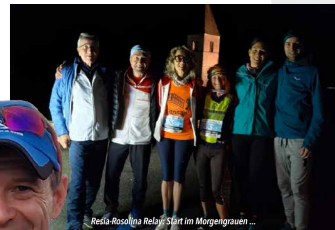
Resia-Rosolina Relay: Start im Morgengrauen ...